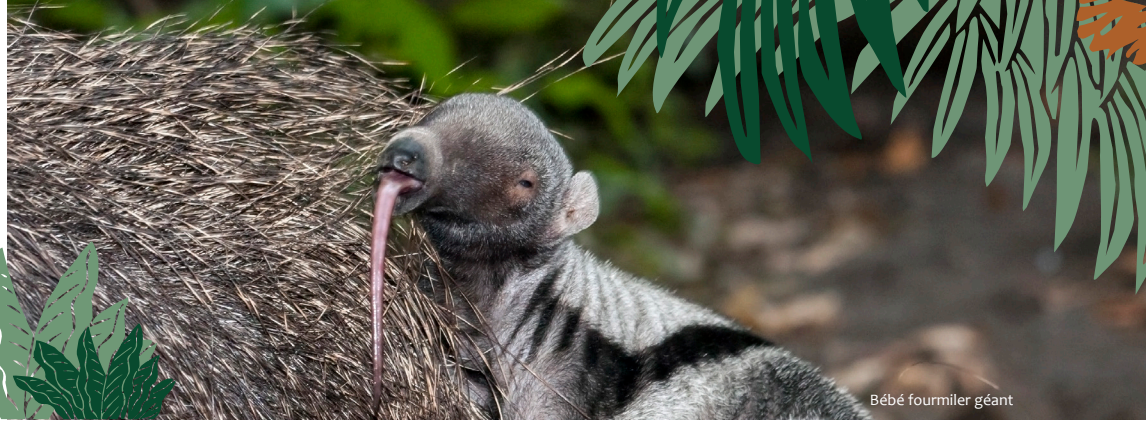
Bébé fourmilier géant